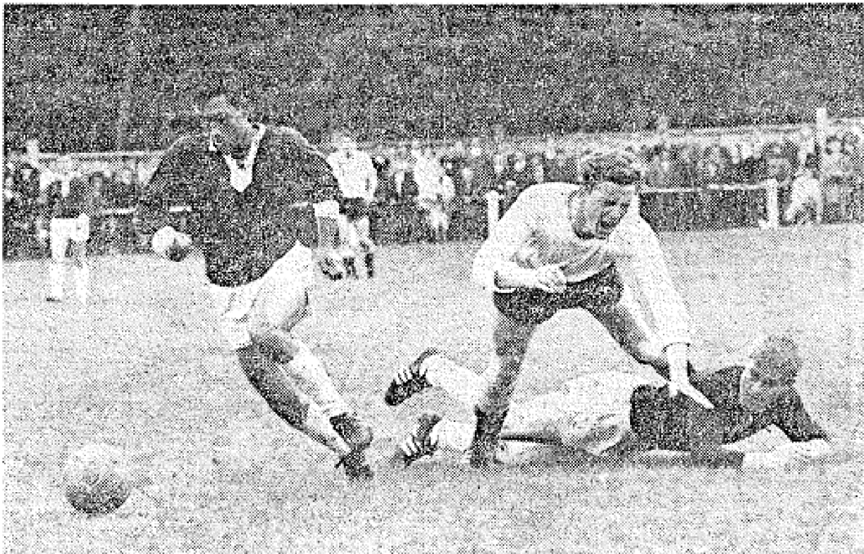
FC „Germania“ Forst — FV Mosbach 2:1; Die Forster Abwehr machte jeden Angriff der Gäste zunichte. Hier klärte Rechtsverteidiger Luft erfolgreich und Hoffmann (dunkles Trikot) bringt das Leder aus der Gefahrenzone.