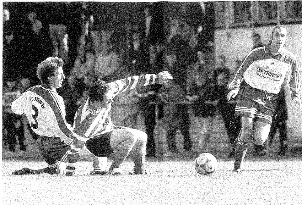
ZWEIKAMPF MIT ZUSCHAUER: Östringens Heger (links) im Duell mit dem Forster Sica, Hirschinger beobachtet das Geschehen aus der Ferne.

De Germanenlibero Udo Hauke binnen kurzer Zeit Eckstein und Heil gleich zweimal gelbwürdig foulte und völlig berechtigt